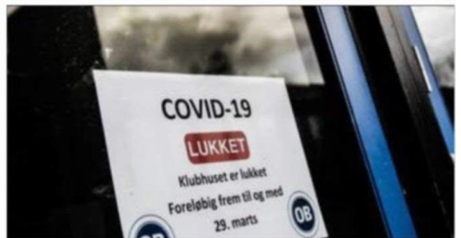
Regeringens forsigtighedsprincip med hensyn til coronaen får ros.