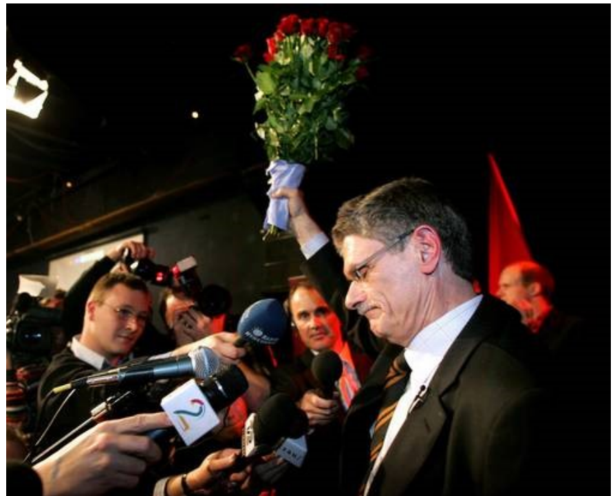
Februar 2005: En bevæget Mogens Lykketoft efter han har meddelt at han går af som formand for Socialdemokratiet efter valgnederlaget.