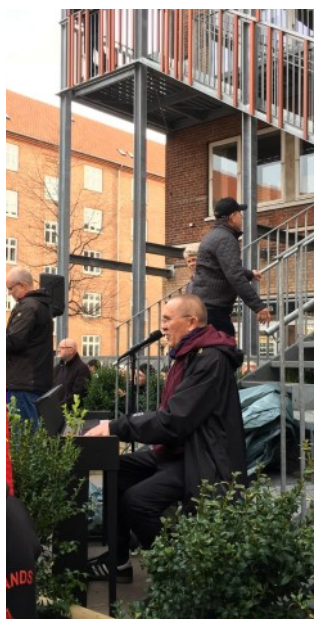
Nis P. spillede bl.a. arbejdersange