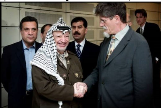
2001: Udenrigsminister Mogens Lykketoft modtager den palæstinensiske leder Yasser Arafat.