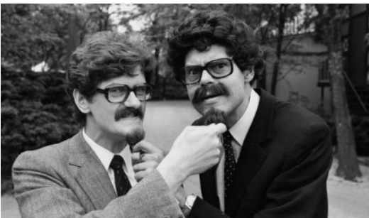
1982: Allerede tidligt i karrieren vakte fipskægget opmærksomhed. Ulf Pilgaard parodierede Mogens Lykketoft i 1982-udgaven af Cirkusrevyen

"Jeg kan huske, jeg var til årsmøde første gang i den her hal i 1967. I dag er 47. gang i løbet af de sidste 50 år, at jeg har talt til årsmøder og kongresser. Jeg meldte mig ind i Socialdemokratiet og var socialdemokratisk aktivtist for 52 år siden - det har jeg været lige siden. Jeg har kæmpet for, jeg har forklaret, jeg har forsvaret, og jeg har udviklet dette partis politik gennem 50 år, sagde Mogens Lykketoft, inden ordene faldt: - I 35 år, halvdelen af mit liv, har jeg været valgt til Folketinget. Fra 1. oktober og frem til næste valg, hvad enten det så kommer før eller siden, vil jeg være tilbage på min plads i Folketinget. Noget andet er, at jeg for nogle måneder siden har orienteret min kredsbestyrelse, at næste gang, 13. gang, stiller jeg ikke op til nyvalg." Sagde Mogens Lykketoft.