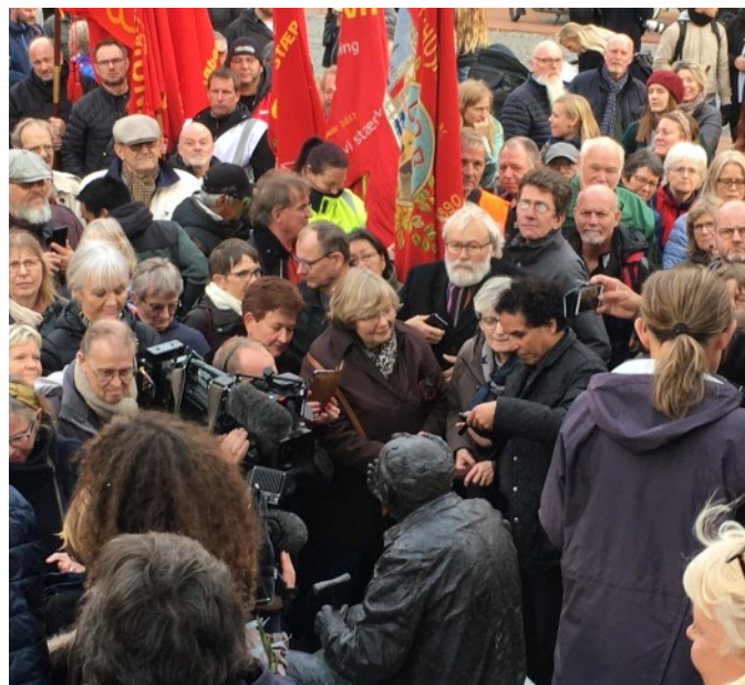
Stor interesse og fremmøde