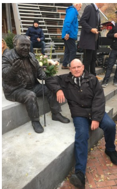
Vores udsendte reporter og fotograf Erling Petterson